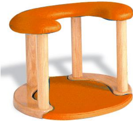
Gestell aus Holz

Geburtsraumgestaltung für die natürliche Geburt