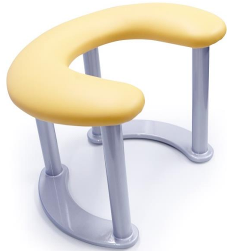
Gestell aus Alu

Eine Wohlfühl-Atmosphäre für Patienten bieten Geburtsraum-Ausstattungen mit Oberflächen, die eine wohnliche Optik vermitteln und qualitativ hochwertig sind. Die leichte Handhabung und sehr gute Aufbereitung der Gebärsysteme ist zudem von wesentlicher Bedeutung.